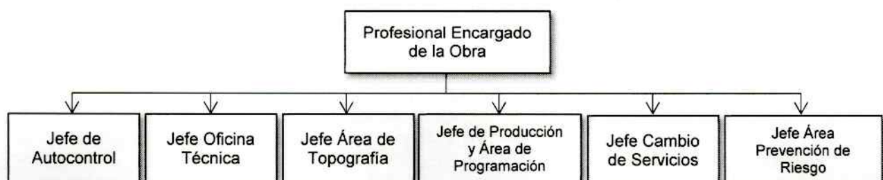
Organigrama N° 1: Equipo Profesional

NOTA: Este esquema de Organigrama es referencial, salvo en el caso del profesional de